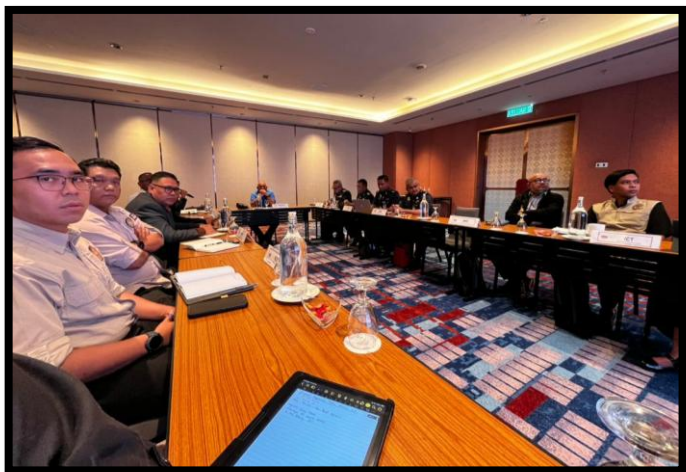
MESYUARAT PENYELARASAN INCIDENT COMMAND SYSTEM (ICS)

GRAND MERCURE HOTEL, KUALA LUMPUR | 13 FEBRUARI 2026