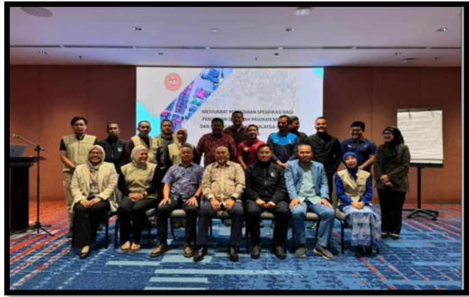
MESYUARAT PEMANTAPAN KESIAPSIAGAAN DAN KOORDINASI LOGISTIK NADMA TAHUN 2026

FAIRFIELD HOTEL, KUALA LUMPUR | 10-12 FEBRUARI 2026