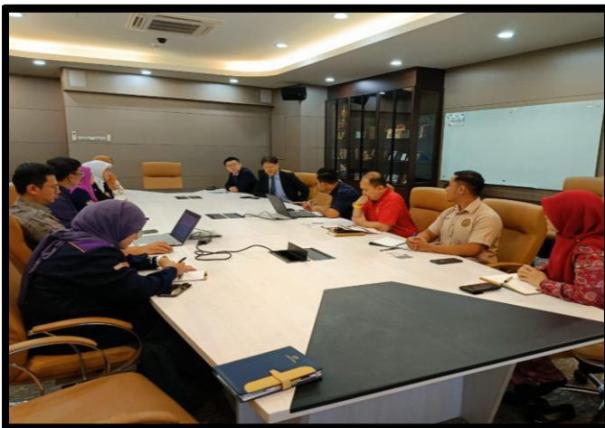
LAWATAN RASMI INSTITUT BIODIVERSITI DAN PEMBANGUNAN LESTARI (IBSD), UITM BERSAMA TETAMU DARI UNIVERSITI RITSUMEIKAN

GRAND MERCURE HOTEL, KUALA LUMPUR | 13 FEBRUARI 2026