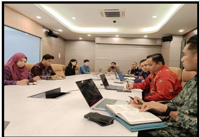
SESI PEMBENTANGAN: NATIONAL COLLABORATION ON AI-DRIVEN REAL-TIME DISASTER MANAGEMENT