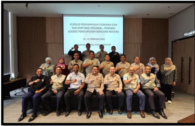
KURSUS PENYAMPAIAN CERAMAH DAN TAKLIMAT BAGI PEGAWAI-PEGAWAI NADMA TAHUN 2026

FAIRFIELD HOTEL, KUALA LUMPUR | 10-12 FEBRUARI 2026