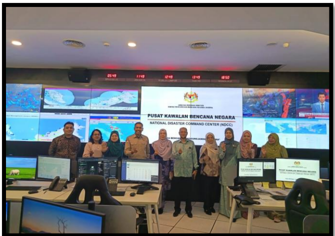
LAWATAN PENANDA ARAS BERKAITAN PENGURUSAN RISIKO INSTITUT AMINUDDIN BAKI (IAB) KEMENTERIAN PENDIDIKAN DI PUSAT KAWALAN BENCANA NEGARA

GRAND MERCURE HOTEL, KUALA LUMPUR | 11-13 FEBRUARI 2026